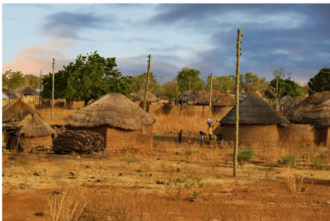
le village traditionnel