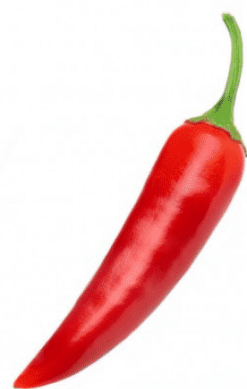
un piment rouge