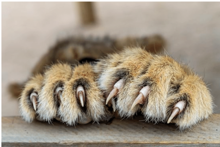
des griffes pointues