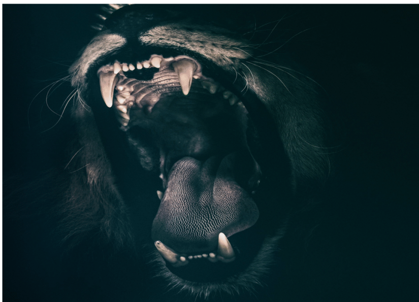
de longues dents